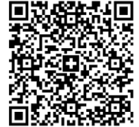
QR Code BVR

Motif versement : Nom(s) et prénom(s) inscrit(s) sur le présent formulaire